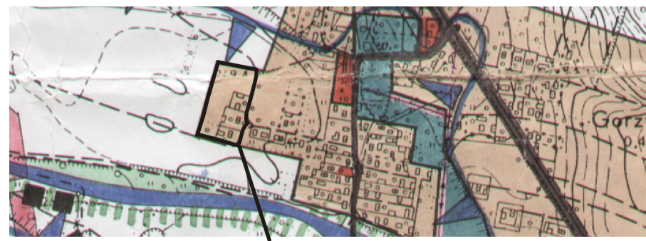
GRANICE OBSZARU OBJĘTEGO ZMIANĄ PLANU

WYRYS ZE STUDIUM UWARUNKOWAŃ I KIERUNKÓW ZAGOSPODAROWANIA PRZESTRZENNEGO GMINY NOWY ŻMIGRÓD SKALA 1:10 000