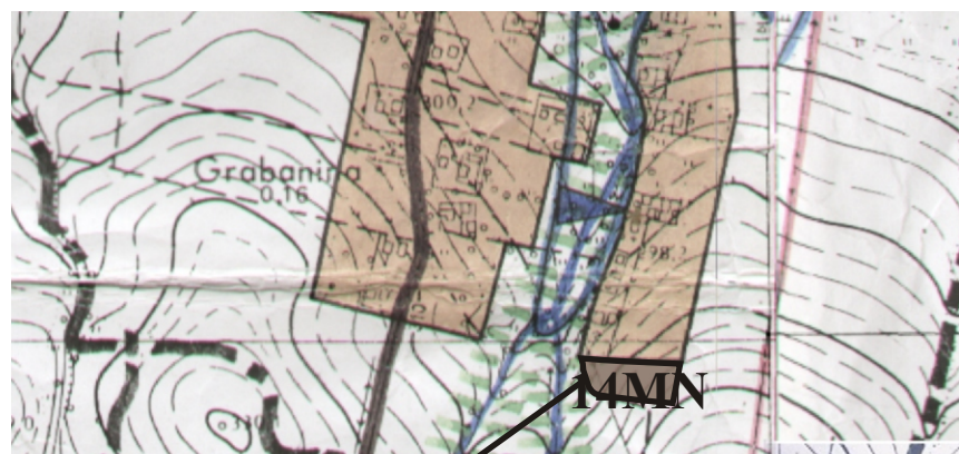
GRANICE OBSZARU OBJĘTEGO ZMIANĄ PLANU