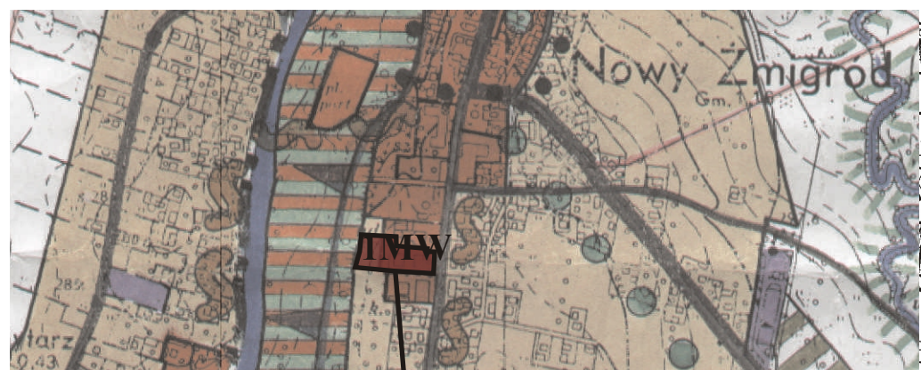
GRANICE OBSZARU OBJĘTEGO ZMIANĄ PLANU