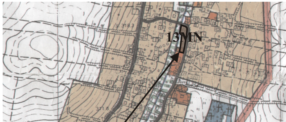
GRANICE OBSZARU OBJĘTEGO ZMIANĄ PLANU

WYRYS ZE STUDIUM UWARUNKOWAŃ I KIERUNKÓW ZAGOSPODAROWANIA PRZESTRZENNEGO GMINY NOWY ŻMIGRÓD SKALA 1:10 000