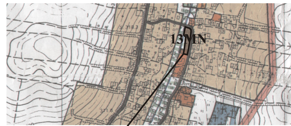
GRANICE OBSZARU OBJĘTEGO ZMIANĄ PLANU

WYRYS ZE STUDYUM UWARUNKOWAŃ I KIERUNKÓW ZAGOSPODAROWANIA PRZESTRZENNEGO GMINY NOWY ŻMIGRÓD SKALA 1:10 000