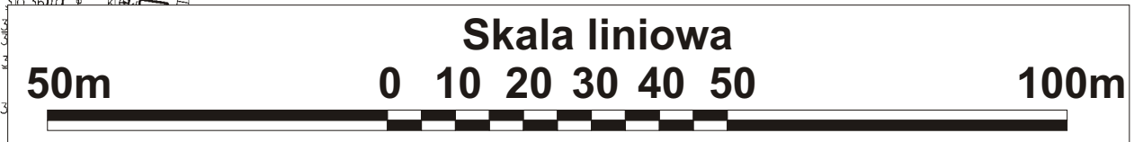
WYRYS ZE STUDIUM UWARUNKOWAŃ I KIERUNKÓW ZAGOSPODAROWANIA PRZESTRZENNEGO GMINY NOWY ŻMIGRÓD SKALA 1:10 000