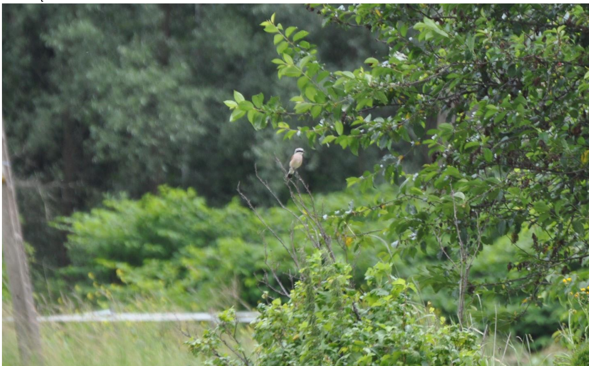
Lanius collurio .

Przy realizacji planowanych zamierzeń należy: