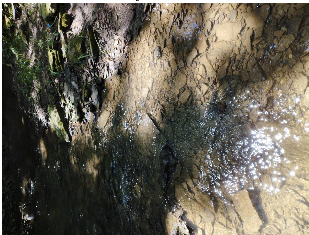
Fot. Kamienisto – skaliste dno ciek Niegołoszcz na odcinku ok 0+000 – 0+400